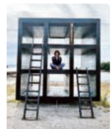
空と風と作品の間