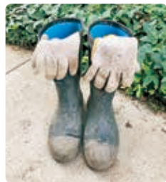
戦い済んで日が暮れて

草刈りは夏中続くので、爽快感は一時的ですね。まあ、シャワーを浴びたあとの晩酌のビールはおいしいですけれど。