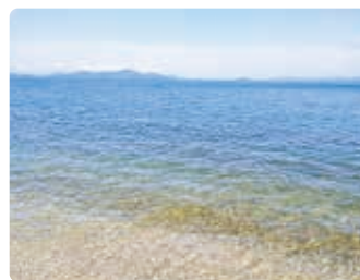
白汀苑からの澄んだ湖水

海と違ってベタベタしないのが何よりの魅力！黄昏時にびわ湖を眺めながら砂浜に腰を下ろすとなんともいえない爽快な気分になります。