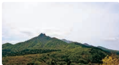
山陰のマッターホルンとも呼ばれるそう