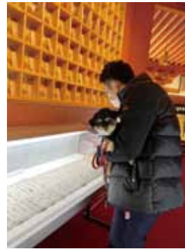
壺阪寺にて古文書を眺める

気に入ります。もち米とうるち米を混ぜ合わせたものに、塩を加えてつき上げるもので、もち米100%とは違って伸びはないのですが、おはぎと同様、うるち米の食感とともに米の甘みも感じられ、つき立ての旨さも格別です。