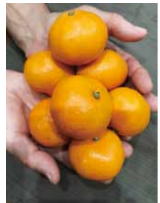
冬はやっぱりみかんです

昔は既に調理済みのものを買ってくることが多かったのですが、いつ頃からか、大晦日に祝い鯛用の生ものを買ってきて正月の朝に焼くこと