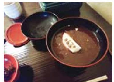
鏡開き後のぜんざいも捨てがたいです...

お正月に食べたいものと言われ真つ先に思いついたのはつきたてのお餅です。祖母の家には家庭用の餅つき器があり、毎年、弟や従兄弟と餅つきを行っていました。