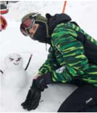
冬山では何を食べてもおいしく感じるマジック

小さな頃、一人っ子にもかかわらず「食べる」に対する熱意はさまざま、競争心も相当なものでした。