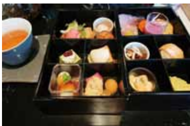
スイーツのお重もまた食べたいです

材が違うようで、甘いものやタレをつけるものなどさまざまな種類があることに驚きました。ご当地ものを