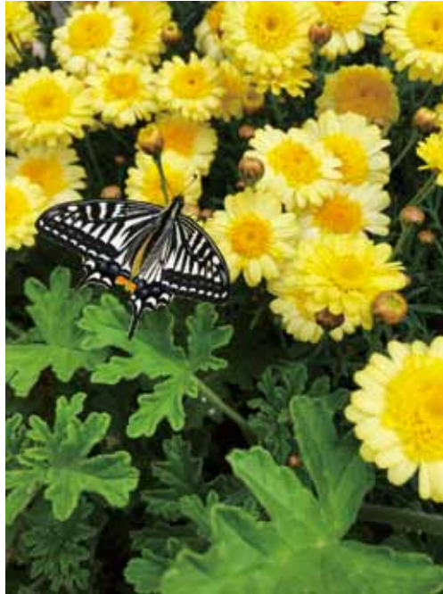
マーガレット&セラニウム