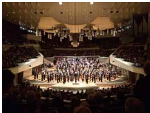
2014ベルリン・フィル定期演奏会(再訪希望★WEBで直接チケットを手配できる時代になりました)

先日は、WEBでコンサートホールツアーが始まるとの告知があり、参加してみました。毎週土日の午前と夕方にドイツ語か英語でのツアーがあり、選択して申し込みます。チケット代金をオンライン決済するとZoomのURLがメールで届きました。時間となりアクセスするとガイドさんが準備しています。Zoomなので、