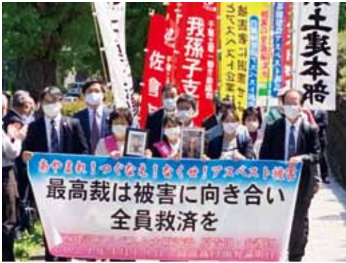
4月19日最高裁弁論に向かう 大阪原告・弁護団

2019年新年号で掲載した「アスベスト被害と向き合ってVOL.4」高裁判決のその先へ」の続編をお届けします。