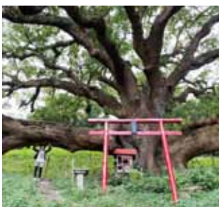
進化した生命力の下で