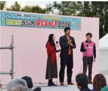
MBSラジオ秋まつりにブースを出店（11月3日 長居公園）

11月3日には、長居公園で開かれたMBSラジオ祭りにも、大阪弁護士会のブースを出店。無料法律相談を行い、大好評でした。 大阪弁護士会を、弁護士を知ってもらおう、もっと身近に感じてもらう、そんな取り組みの一環です。