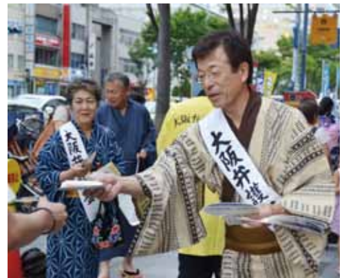
天神橋筋商店街でリーフを配布

昨年9月の岩手県の大水害で、復興行政官が、長靴を履かずに現地に行き、おんぶされて視察をしたという事件が起きました。大災害時に、中央官僚組織が何の役にも立たないことが、証明される事になってしまいました。