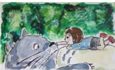
たまには美術のお勉強

夜中、久しぶりに無性に絵筆がとりたくなり、書きかけの書面を照らすパソコン画面の前で、水彩画を仕上げる。そういえば、美術の時間に描いた油絵がどうしても気に入らず、持って帰った次の日に全面青と黒で塗りつぶし、全く別の絵にしたことがあった。私にとつて作品は、始まりと終わりのちょうど真ん中あたり。ここからどう変化するか自分でも分からない、そんなところで止めるのが、なんとも心地よく好きでした。そんな自分をいつから忘れていたんだろう。生まれたばかりの絵の前に、苦笑いする7年目の冬です。