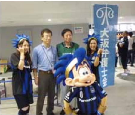
ガンバ大阪の吹田サッカースタジアムに大阪弁護士会のブースを出店（8月20日）

昨年8月21日からは、大阪弁護士会と友好協定を結んでいる韓国のソウルに約10人の弁護士で訪問し、弁護士の研修制度、離婚制度についての交流をしました。 印象深かったのは、日本では協議離婚をするには、夫婦の話し合いで届出さえすればいつでも離婚できるのですが、韓国では、裁判所に申請