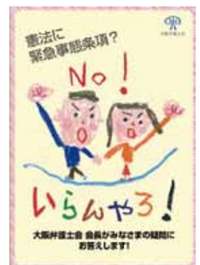
「緊急事態条項」いらんやろ

の商品を買わされる被害が相次いでいます。そこで、老人会や施設へ、消費者被害専門の弁護士を派遣して学習会をしています。犯罪被害者への出張相談、憲法についての無料の勉強会への講師派遣、老人ホームへ本人や家族への遺言・相続問題での出張相談等、多くの所に出かけています。