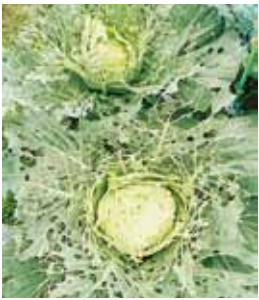
キャベツ。みごとにレース模様です。

日常のことを忘れて本当に夢中になれる趣味を、今年は始めたい。(と毎年思っています)。