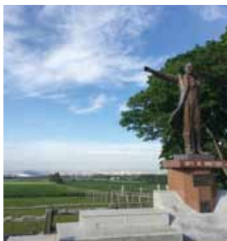
大志を抱いて何が悪い

だから今年は何も決意しない、始めない、そう決めていきます。「今ここ」にすでにやるべきことはあって、そこに集中してやってきました分、ここからはやるべきことをやる、そこに新たな決意はいらないから、今年「始」めない元年なんです。天邪鬼ですが。