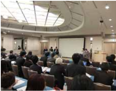
第19回 日弁連業務改革シンポジウム

法律事務所の事務職員は、裁判所の書記官や検察庁の事務官と同じように市民の権利や財産に関する重要な事務を扱う業務なのに、これまで業務に対する客観的評価もなく社会的地位も低いままだった。例えば一般的に法律事務