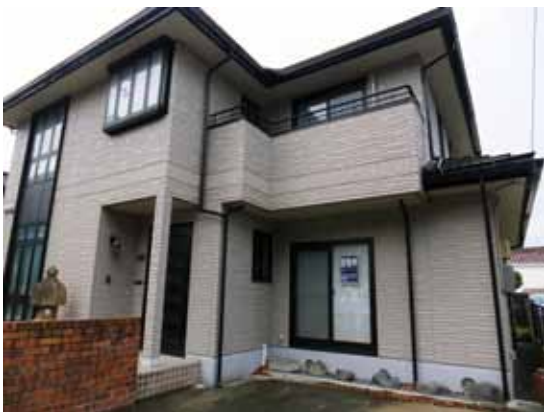
売物件の貼紙がある空家