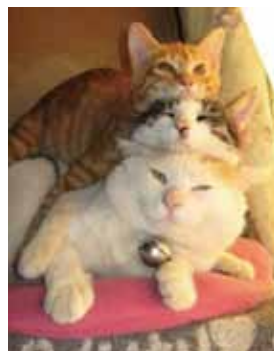
「せめて、猫に埋もれて」

の夢はおまわりさんになって交通整理をすること。そして孫2がワクワクしながら聞きます。