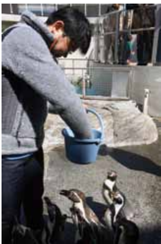
「ペンギンにも夢を」

鈍っておらず、思った以上に動くことができ、相手の動きに対する反応も素晴らしく、みごと「出ばな小手」や「逆胴」を決めているシーンが再生されています（快感）。