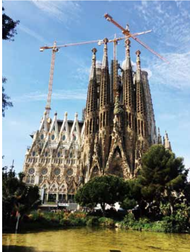
スペイン バルセロナ「サグラダ・ファミリア」2019年4月