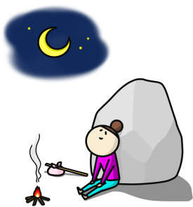
最後に笑うのは私

今はリフレッシュどころではないけれど、スポーツも読書も映画鑑賞も旅行も酒宴もイタズラも、好きだけできるようなとにかく今は頑張るしかありません。