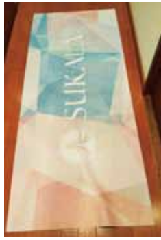
新しいヨガマット

心地よい音楽を聞きながら、呼吸と自分の体に意識を向けて、ゆったりした気持ちで1時間を過ごすと、気持ちも穏やかになり、家族や自分の周りの人々への感謝の心も芽生えます。