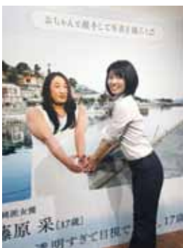
ロバート秋山・クリエーターズ カフェは最高